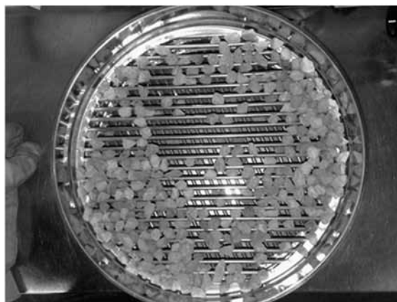
Rys. 1. Sita prętowe podczas przesiewania

Jeżeli suma mas R_i łącznie z masami każdej z odrzuconych frakcji o danym wymiarze ziarn różni się więcej niż 1% od masy M_0 (masa próbki analitycznej), badanie należy powtórzyć na innej próbce analitycznej. Otrzymane wyniki zamieszczono w tablicy 3.