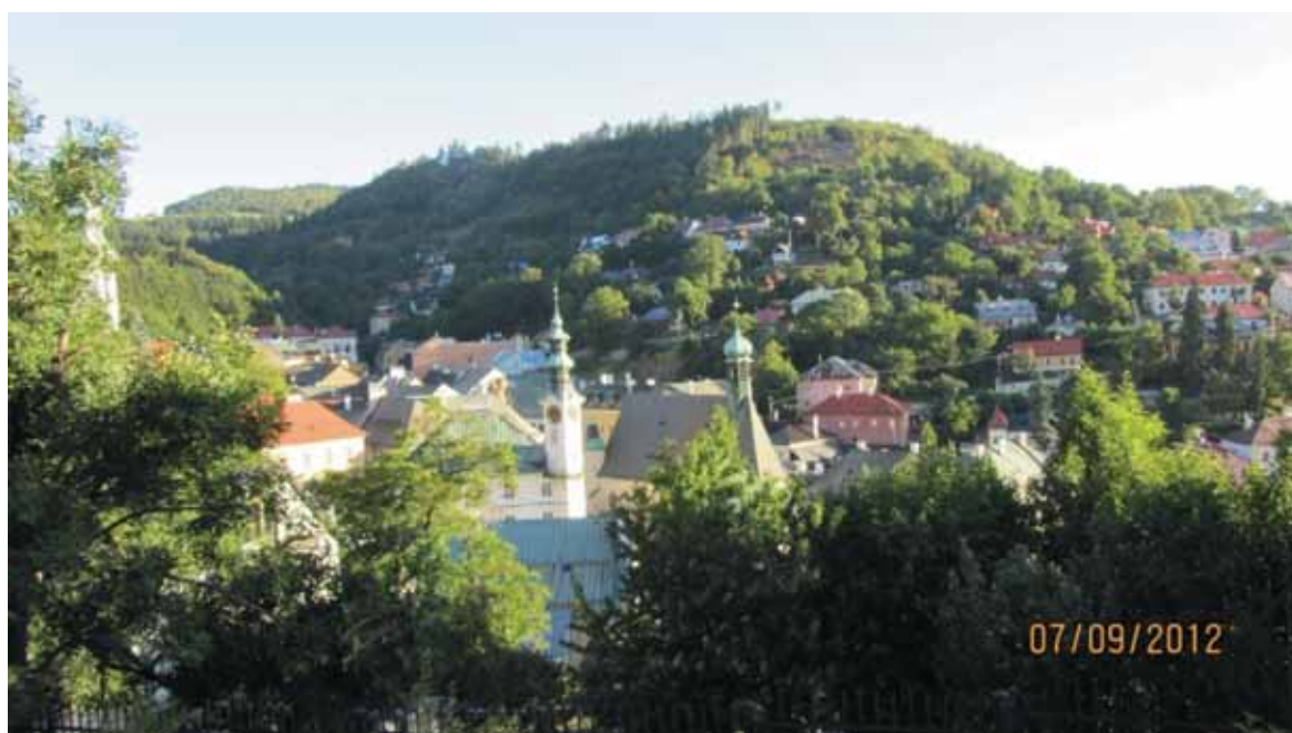
Rys. 2. Współczesna panorama Bańskiej Szczawnicy i okolic. Fig. 2. Contemporary panorama of Bańska Štiavnica and its surroundings

ogłoszony 13 grudnia 1762 r., dający nowy impuls dla rozwoju szkolnictwa i podnoszący je na wyższy poziom. W następstwie dekretu rok później utworzono Wyższą Szkołę Górniczą w Bańskiej Szczawnicy oraz Departament Nauk Górniczych w Pradze. Co więcej, zalecono wprowadzenie nauczania górnictwa i nauk o Ziemi we wszystkich istniejących uniwersytetach Cesarstwa Austro-Węgierskiego.