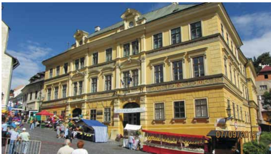
Rys. 3. Dom Fritza siedziba rektoratu Akademii Górniczej i Leśnej w XIX wieku Fig. 3. Fritz House seat of the Mining and Forest Academy president's office in the 19th century

Pierwsze wzmianki dotyczące utworzenia w Rosji szkoły górniczej przypisuje się reformatorskiemu carowi Piotrowi I oraz uczonemu Michaiłowi Łomonosowowi na początku XVIII w. Pomysły te zostały zrealizowane przez carycę