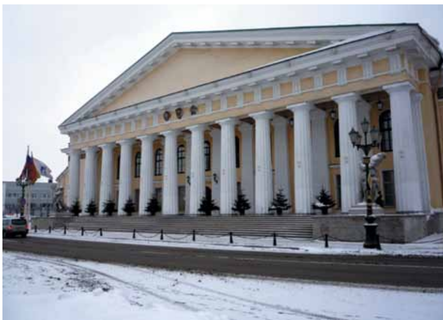
Rys. 4 Instytut Górniczy w Petersburgu – widok współczesny. Fig. 4. Mining Institute in St. Petersburg – contemporary view

Katarzynę II, która podpisała stosowny edykt w listopadzie 1773 r. ustanawiający w Petersburgu Szkołę Górniczą ( Gornoje Uczyliszcze ) w celu kształcenia górniczych kadr inżynierskich. Od początku działalności szkoła ta była również ośrodkiem badań naukowych z zakresu górnictwa i geologii. Co ciekawe, rzeczywistym inicjatorem i organizatorem szkoły był Ismail Tasimow, przedsiębiorca górniczy z Baskirii, który wyłożył na ten cel własne środki finansowe. W założeniu utrzymanie szkoły miały zapewnić środki pochodzące z wydobycia kopalni, z jego przedsiębiorstwa oraz od innych przedsiębiorców — członków komitetu założycielskiego. Fakt ten niewątpliwie pozytywnie nastawił carycę Katarzynę II, która zatwierdziła postulaty komitetu założycielskiego i 28 czerwca 1774 nastąpiło uroczyste otwarcie szkoły, do realizacji tego przedsięwzięcia. Pierwotnym zamysłem organizatorów szkoły była powszechna dostępność, nie ograniczająca nauczania tylko do zamożnych studentów.