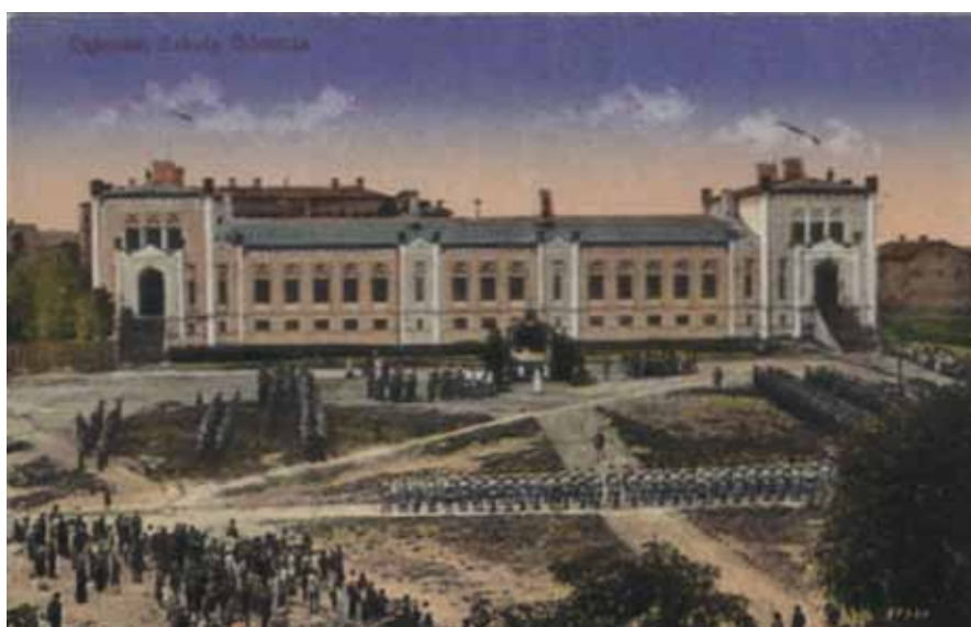
Rys. 5. Szkoła górnicza „Szttygarka” w Dąbrowie Górniczej Fig. 5. Mining School “Szttygarka” in Dąbrowa Górnicza