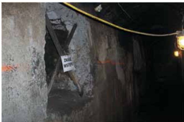
Rys. 3. Widok ociosu wyrobiska okonturowującego reaktor wraz z wlotem do kanału OI, po zatrzymaniu procesu zgazowania i wychłodzeniu reaktora

komory łączącej kanał OI z rurociągiem, którym podawany był tlen, było wynikiem przybliżenia się strefy procesu zgazowania do obudowy betonowej wyrobiska (cofanie się procesu w kierunku rurociągu z czynnikiem zgazowującym), a następnie jej rozszczelnienia pod wpływem wysokiej temperatury. Taki kierunek zgazowania był wynikiem podawania do georeaktora tylko tlenu jako medium zgazowującego. Kierunek zgazowania tlenem był inny niż kierunek zgazowania pokładu powietrzem w 2010 roku.