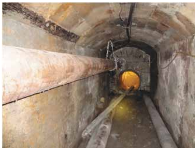
Rys. 1. Wyrobisko w obudowie murowej-betonowej okonturowujące georeaktor – od strony wlotu powietrza

drugą tamę izolującą przeciwybuchową, która w przypadku powstania stanu awaryjnego umożliwiała przerwanie ciągłości przewietrzania i odizolowanie wyrobisk okonturowujących georeaktor od czynnych wentylacyjnie wyrobisk.