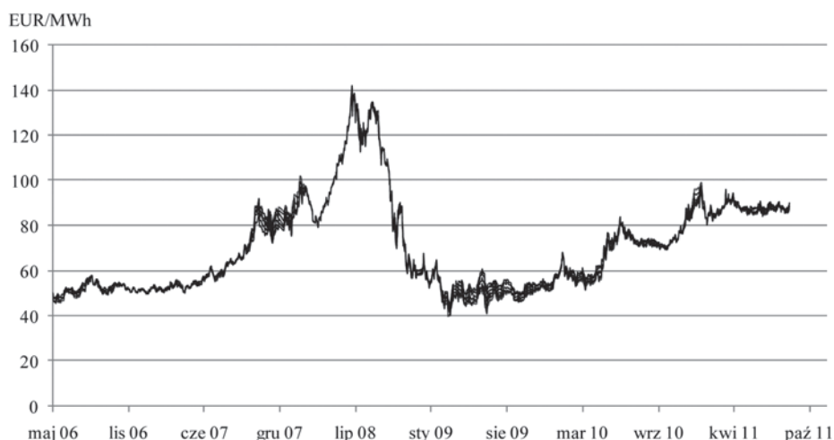
Rys. 1. Ceny węgla w kontrakcie futures FT2M w dostawie na kolejne 6 miesięcy