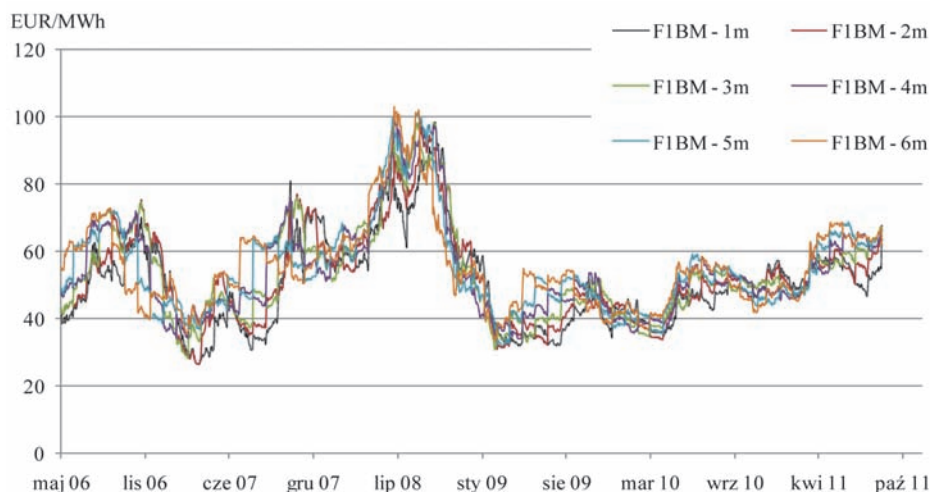
Rys. 2. Ceny energii w kontrakcie F1BM w dostawie na kolejne 6 miesięcy