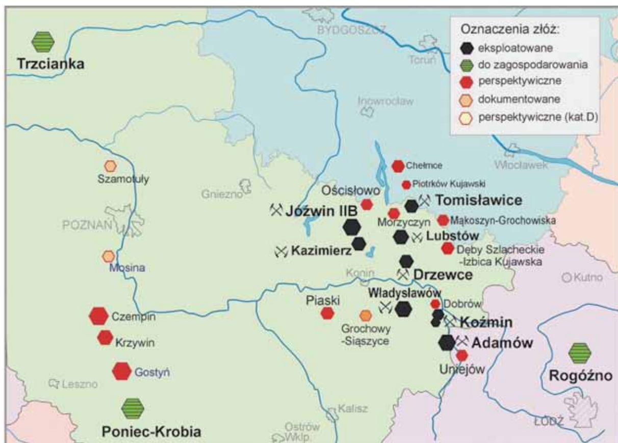
Rys. 2. Lokalizacja złoża Trzcianka na tle zagłębia adamowskiego i konińskiego [Opracowanie własne]