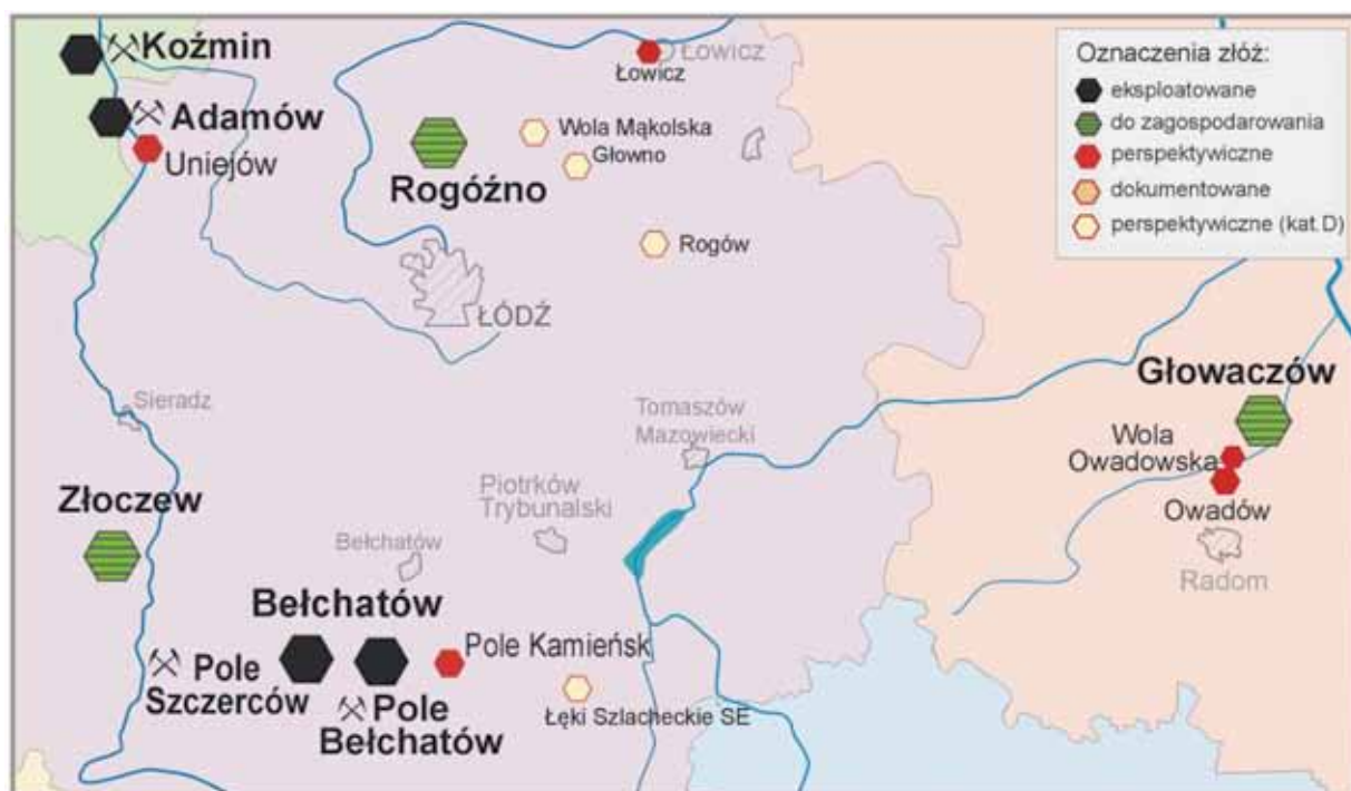
Rys. 3. Lokalizacja złoża Rogóźno, Głowaczów i Złoczew na tle zagłębia górniczo-energetycznego adamowskiego i belchatowskiego [Opracowanie własne]