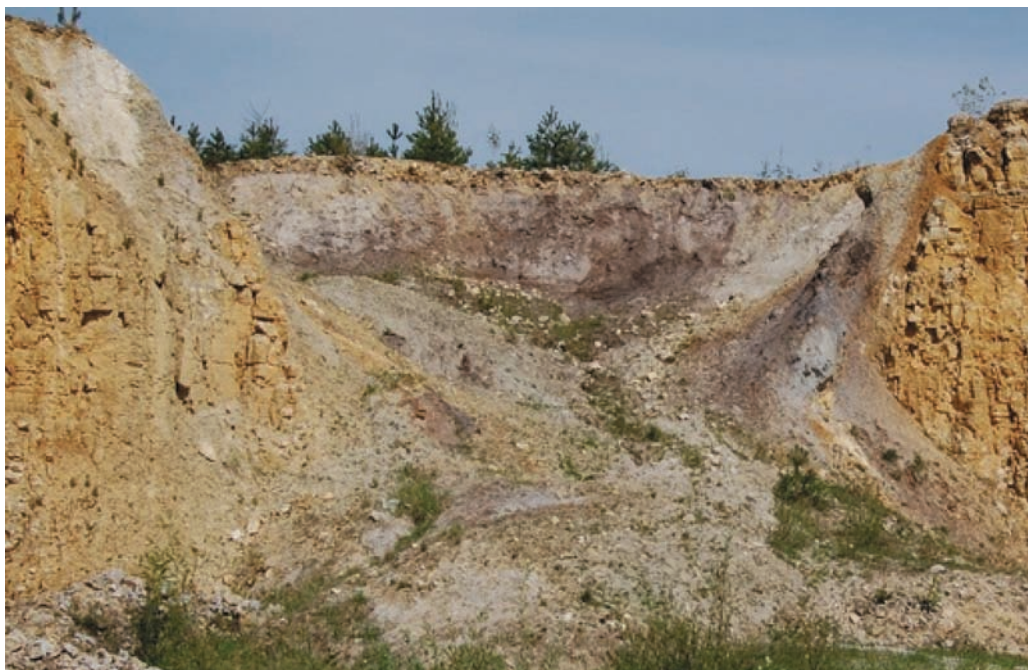
Rys. 2. Przykład osuwiska powstałego przez kras w kopalni wapienia Fig. 2. Example of the land slide formed by karst in limestone mine

i różnego rodzaju środki, w tym materiały wybuchowe, do wydobywania kopaliny ze złoża. Zaliczyć można tutaj w szczególności [2]: