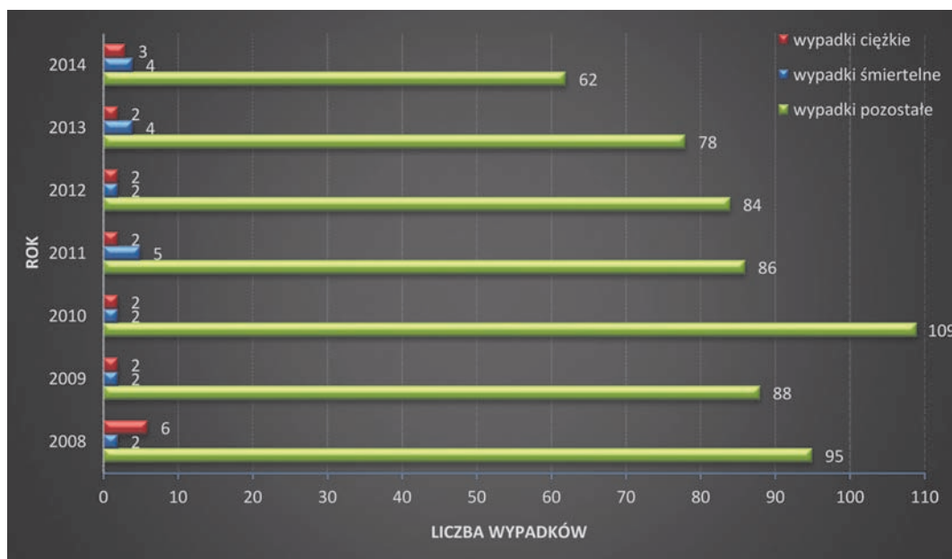
Rys. 4. Struktura wypadków w górnictwie odkrywkowym w latach 2008-2014