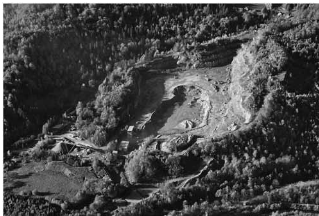
Rys. 4. Kopalnia piaskowców godulskich w Wiśle, złożo Oblaziec-Gahura [12] Fig. 4. Cretaceous sandstone quarry in Wisła, Oblaziec-Gahura deposit [12]

do produkcji kruszyw dla budownictwa i drogownictwa, w mniejszym stopniu do produkcji nawozów wapniowo-magnezowych [14].