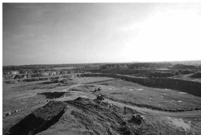
Rys. 3. Kopalnia dolomitu w Siewierzu, złożo Nowa Wioska [16] Fig. 3. Dolomite rock quarry in Siewierz, Nowa Wioska deposit [16]

W Bilansie zasobów złóż kopalni w Polsce (2014) [6] w grupie kopalni określanymi jako „kamienie łamane i bloczne” skały osadowe węglanowe ujęte są w jednej grupie. Na terenie województwa śląskiego udokumentowanych jest 20 złóż należących do tej grupy – dolomitów, wapieni, oraz wapieni dolomitycznych [6]. Złoża te przeważnie występują w formie pokładowej, rzadziej w formie masywu ( Imielin-Północ, Nowa Wioska ). Związane są one głównie z utworami triasu środkowego (wapień muszlowy), choć zdarzają się także złoża dewońskie ( Podleśna ), górnourajskie ( Rębielice Królewskie I, Rudniki II ) i dolnokredowe ( Leszna Górna , rys. 2) [15]. Eksploatacja prowadzona jest w 6 złożach: Imielin (wapień i dolomity), Imielin-Północ (dolomity), Imielin-Rek (wapień dolomityczny), Leszna Górna (wapień), Nowa Wioska (dolomity, rys. 3) i Podleśna (dolomity). Całkowite wydobywanie w roku 2013 wyniosło 2028 tys. t [6]. Surowiec uzyskiwany z tych złóż wykorzystywany jest przede wszystkim