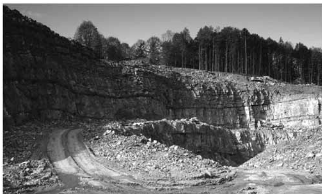
Rys. 2. Kopalnia wapieni cieszyńskich w Lesznej Górnej [13] Fig. 2. Cretaceous limestone quarry in Leszna Górna [13]

zasobów bilansowych i ponad 71 % zasobów przemysłowych [6]. Złoża te mają budowę pokładową i są wieku triasowego (wapień muszlowy). Jedynie w złożu Brudzowice (powiat będziński) oprócz dolomitów triasowych występują także dolomity dewońskie (żywet) [15]. Zasoby tych złóż zostały rozpoznane wstępnie lub szczegółowo. Tylko z dwóch złóż – Ząbkowice Będzińskie I (Dąbrowa Górnicza) i Brudzowice – prowadzone jest wydobywanie (74 % krajowego wydobycia). Kopalina, po procesie przeróbczym, ma zastosowanie w hutnictwie, wykorzystywana jest także w rolnictwie do produkcji nawozów wapniowo-magnezowych, a także jako kruszywo budowlane [6].