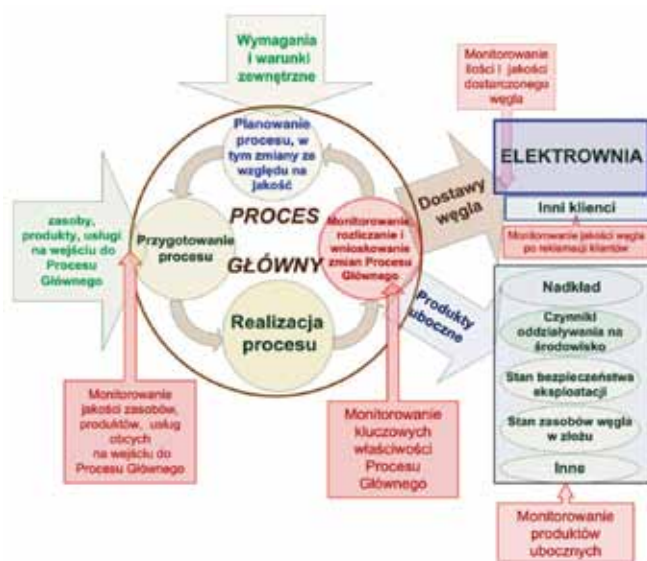
Rys. 3. Schemat monitorowania i pomiarów kluczowych właściwości Procesu Głównego (opracowanie własne)