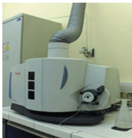
Rys. 2. Spektrometr emisyjny iCAP 6500 DUO Fig. 2. Emission spectrometer iCAP 6500 DUO